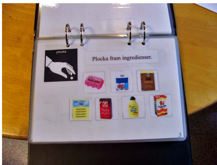
Ett exempel på ett plocka fram blad.

Detta exempel är hämtat från dagverksamhet som gör bildrecept till en särskola.